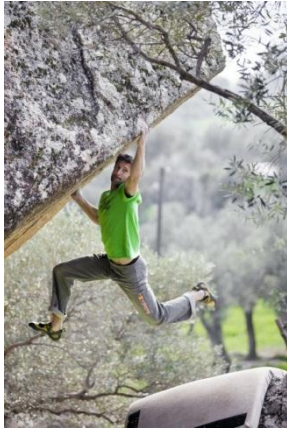
Reinhard Fichlinger/Red Bull Content Pool