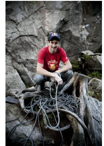
Reinhard Fichtinger/Red Bull Content Pool