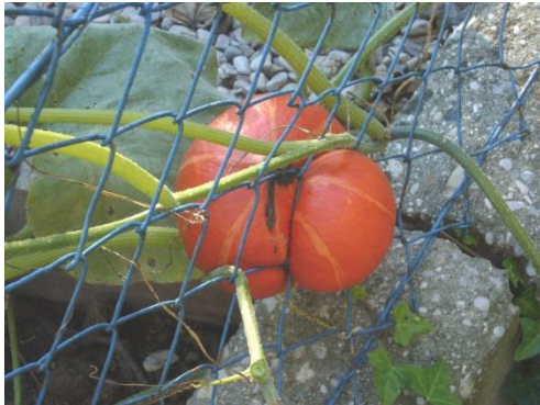
Foto: „NÖ überwindet Grenzen“ – Jacob Gobauer, NMS Seitenstetten-Biberb.

Name der Schülerin/des Schülers: Johanna Halbartschlager Alter: Schule: NPMS Amstetten Klasse: 3. Ort: 3300 Amstetten