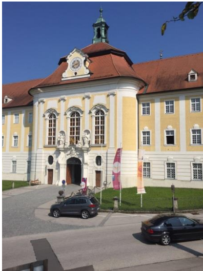
Foto: „Stift Seitenstetten“ – Pauli und Nico P., NMS Seitenstetten-Biberbach