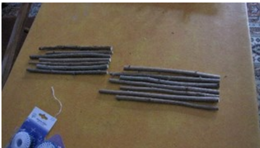
Hölzer für Wände