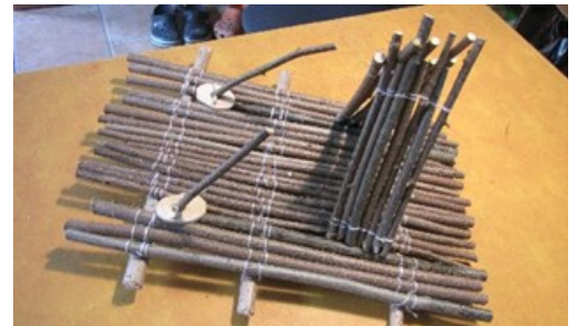
So könnte das fertige Floß aussehen.