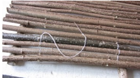
Die „Langstämme“ werden zusammengebunden.