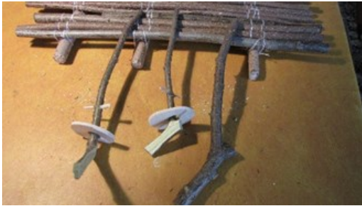
zwei fertige Ruder