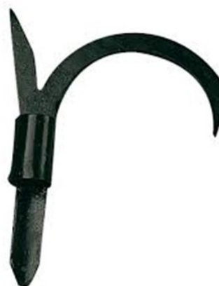
Floßhaken ohne Stange

Für lange Reisen, in unserer Gegend vor allem auf den Flüssen Main und Donau, richteten sich die Flößer gelegentlich auch einfache Unterkünfte aus Holz in Zelt- oder Hausform auf.