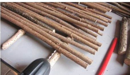
Bohrlöcher zum stabileren Verbinden