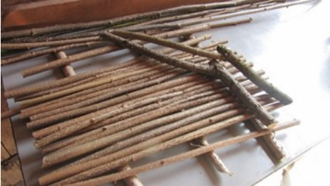
Stangen und Aststücke für Ruder

30 Rundstäbe aus Naturholz, 15 – 20 Meter reißfester Spagat aus Kunstfaser