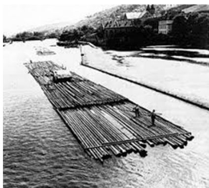
Drei zusammenhängende Flöße

Lange Zeit war die Floßfahrt ein wichtiger Wirtschaftsfaktor für die Länder entlang der Donau.